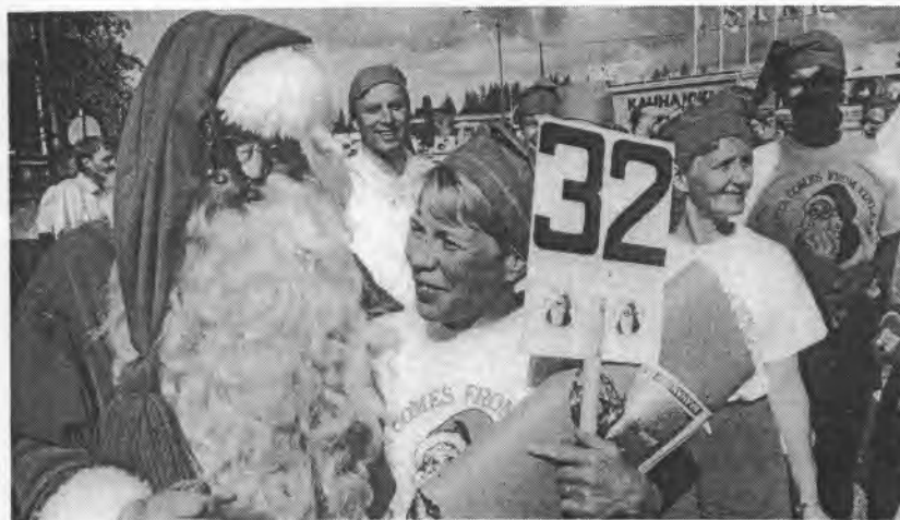
Mitä lie joulupukki kuiskuttanut nimikkojoukkueensa pukin partion korvaan? Sitäkö, että olkaa Suomi-juoksijat lopun matkaa kiltejä ja eläkää siististi.

Se ei voi olla oikein! Mikä sellainen rauhantapahtuma on, jossa ei edes lähimmäisestä pidetä huolta.